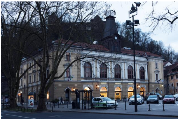
LGL na Krekovem trgu pod Ljubljanskim gradom