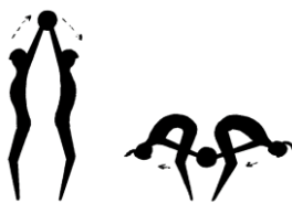
3. Vaja: z.p. – stoja razkoračno, s hrbti drug proti drugemu. A. – prvi dvigne žogo nad glavo, drugi jo prevzame ter vrne pravemu skozi korak (žoga kroži).