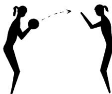
1. Vaja: z.p. – na razdalji 2 – 3 m s čelom drug proti drugemu. A. – met žoge z obema rokama naprej – gor (oberočna zgornja podaja).