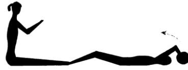
5. Vaja: z.p. — prvi: sed snožno prednožno. drugi: leža na hrbtu (s stopali skupaj). Ležeči ima žogo nad glavo. A. — ležeči — predklon in podaja žoge sedečemu. Sedeči se spusti nazaj v ležo izmenoma.