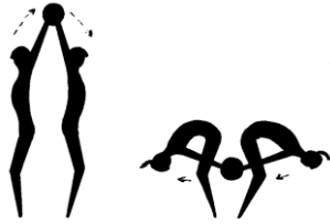
3. Vaja: z.p. — stoja razkoračno, s hrbti drug proti drugemu. A. — prvi dvigne žogo nad glavo, drugi jo prevzame ter vrne prvemu skozi korak (žoga kroži).