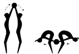
3. Vaja: z.p. – stoja razkoračno, s hrbti drug proti drugemu. A. – prvi dvigne žogo nad glavo, drugi jo prevzame ter vrne pravemu skozi korak (žoga kroži).