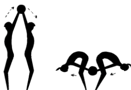
3. Vaja: z.p. – stoji razkoračno, s hrbti drug proti drugemu. A. – prvi dvigne žogo nad glavo, drugi jo prevzame ter vrne pravemu skozi korak (žoga kroži).