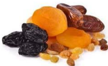
mlečni riž/zdrob/kaša s suhim sadjem