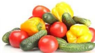
jajca, polnozrnat kruh in zelenjava