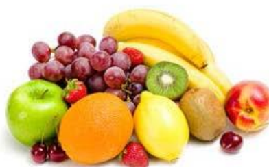
ovseni/pirini/rženi kosmiči (kuhani ali namočeni), jogurt, sadje