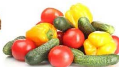
pršut/losos/sir, mlečni namaz, polnozrnat kruh, zelenjava.