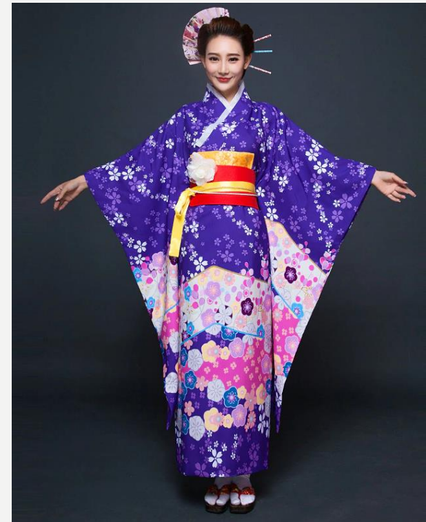
JAPONCI – SVILENA OBLAČILA