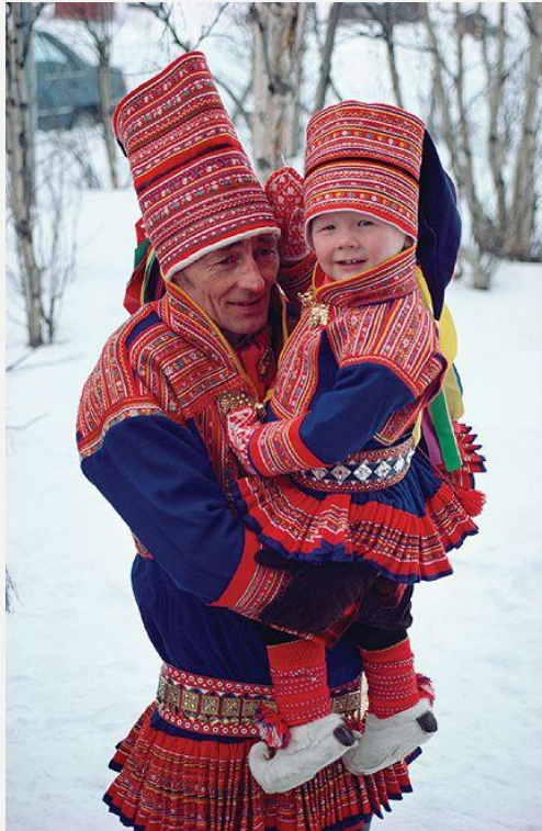
LAPONCI – VOLNENA OBLAČILA