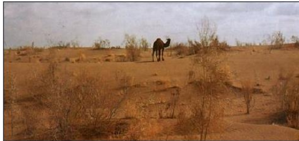
Polpuščava v Turkmenistanu

- Rastlinstva, razen ob rekah, skorajda ni. Puščavsko in polpuščavsko rastje je odvisno od letne količine padavin.