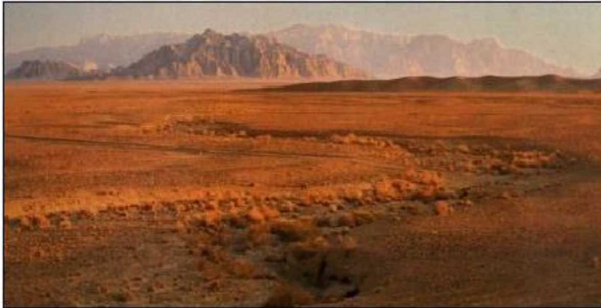
Stepa v Uzbekistanu