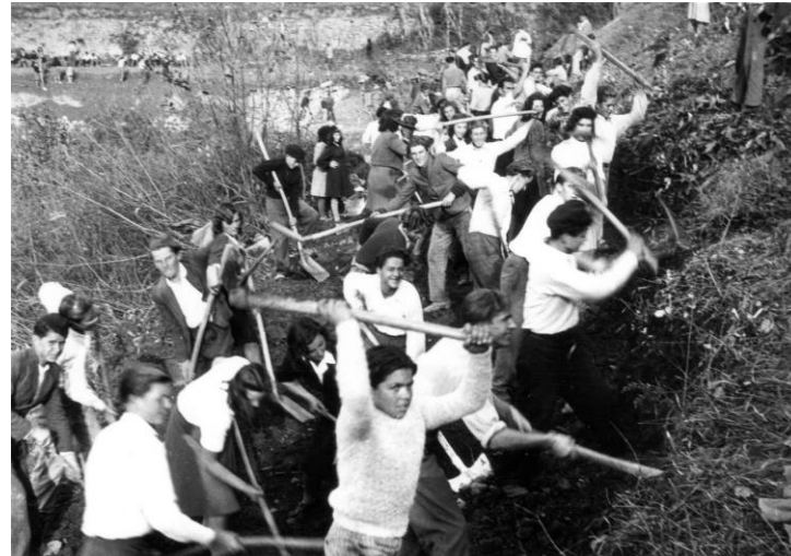
↙ Mladinska delovna brigada v Šmarjah