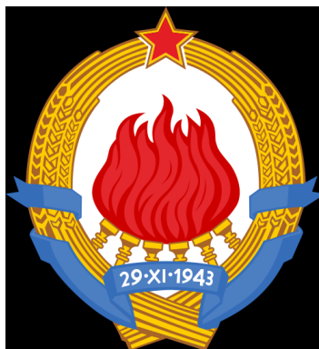
Jugoslovanska zastava in grb