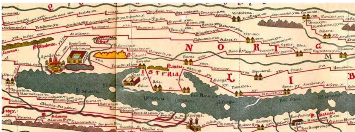
Tabula Peutingeriana – zemljevid iz 13. stoletja (kopija prvega rimskega zemljevida cest)