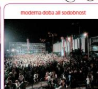
moderna doba ali sodobnost