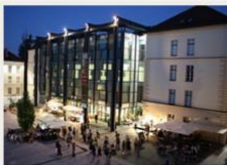
Slovenski etnografski muzej