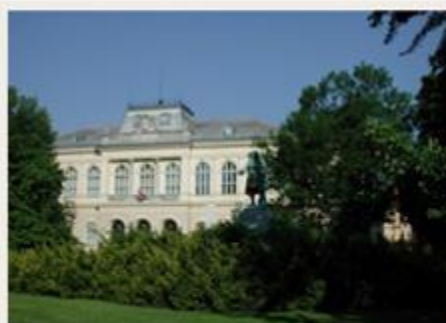
Prirodoslovni muzej Slovenije