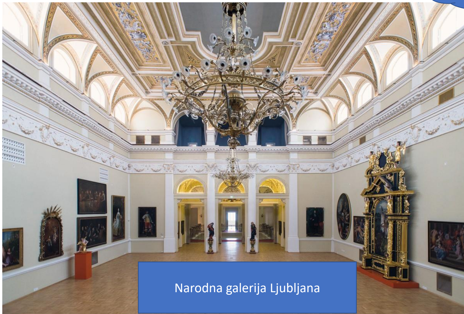
Narodna galerija Ljubljana