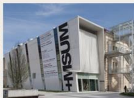
Muzej sodobne umetnosti Metelkova (MSUM)