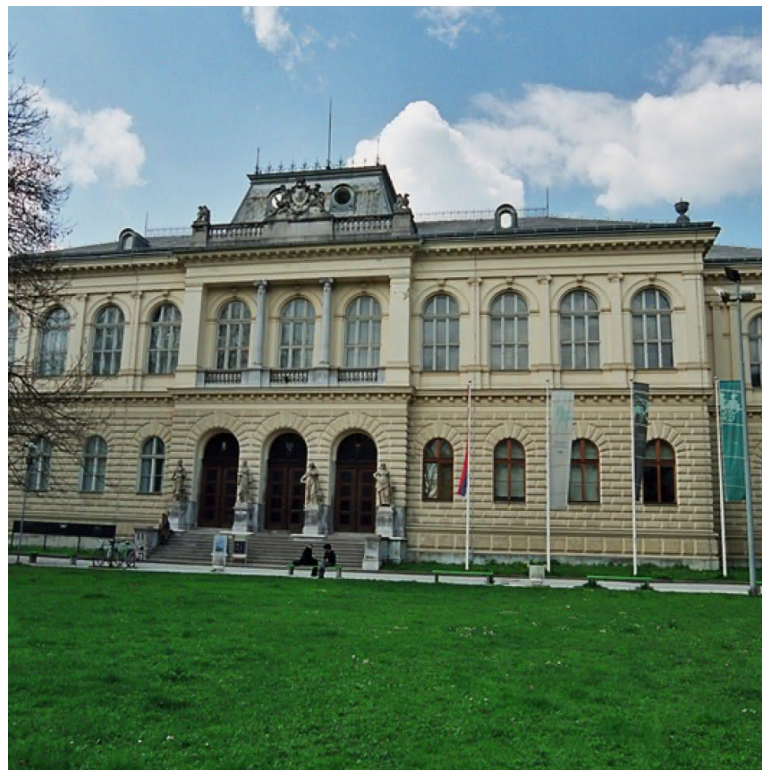
Narodni muzej Ljubljana