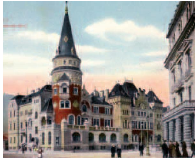
Nemci so ustanavljali »nemške hiše«, ki so bile središča zbiranja nemških društev in kulturnih prireditev. Nemški domovi so nastali v Celju (na sliki), Mariboru, Ljubljani (Kazina), na Ptujju ...

B. Kako so se organizirali Nemci v slovenskih deželah?