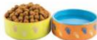
HRANA IN VODA