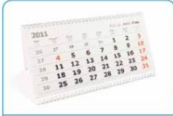
NA KOLEDARJU SO OZNAČENI MESECI, TEDNI, DNEVI.