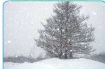
POZNAMO RAZLIČNE VREMENSKE POJAVE.