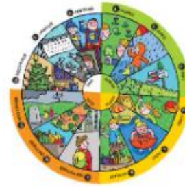
LETO IMA ŠTIRI LETNE ČASE.