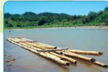
NEKATERE SNOVI NA VODI PLAVAJO, NEKATERE V VODI POTONEJO.