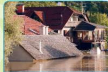
RAZLIČNI VREMENSKI POJAVI IN PADAVINE VPLIVAJO NA ŽIVLJENJE LJUDI, ŽIVALI IN RASTLIN.