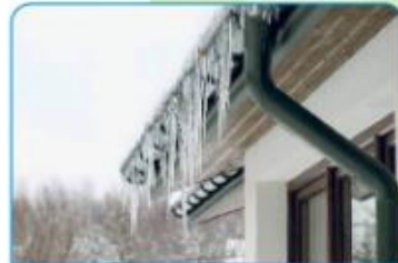
VODA JE LAHKO V TEKOČEM, TRDNEM ALI PLINASTEM STANJU.