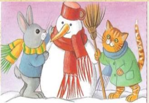
FEBRUJAR – SVEČAN