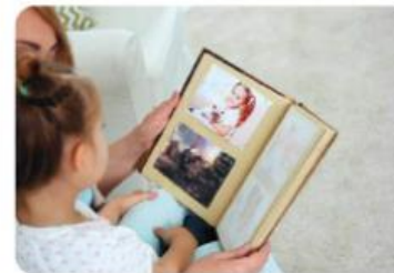
Mama in hči si ogledujeta album s fotografijami iz svoje preteklosti.

Čas, ko smo bili dojenčki, je preteklost. Sedaj smo šolarji in to je sedanjost. Preteklost so tudi dogodki, ki so se zgodili pred eno uro, prejšnji teden, pred enim letom.