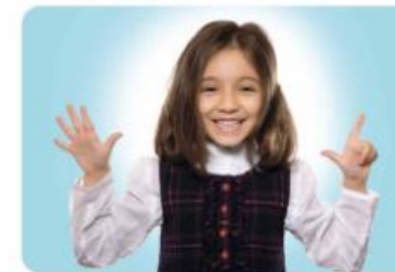
Čas, ki je sedaj, imenujemo sedanjost.